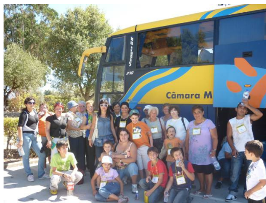
Viagem a Fátima