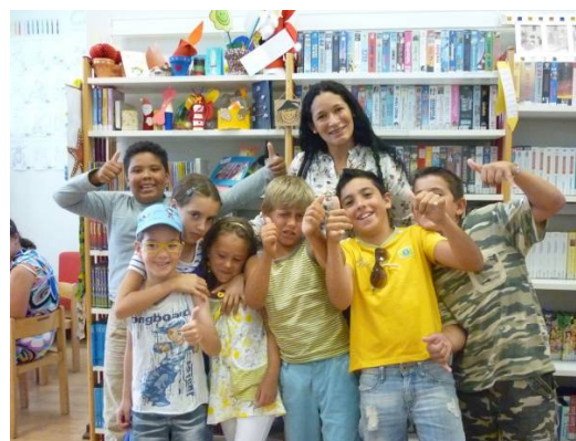
Dia Mundial da Biblioteca