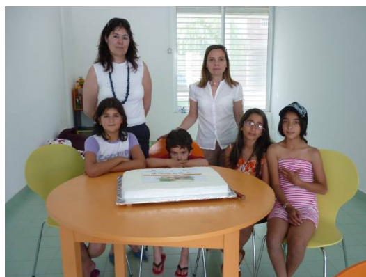
Hora do Conto