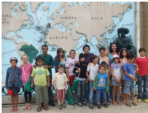
Visita Portugal dos Pequenitos