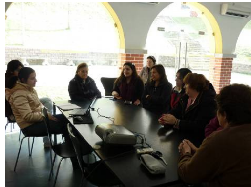
“A Família e o Álcool”, no âmbito do Projecto Vivências, em parceria com o GIS (Grupo de Instrução e Sport)