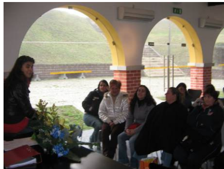
“Técnicas de Procura de Emprego”, no âmbito do Projecto Vivências, em parceria com o GIS (Grupo de Instrução e Sport)

O principal objectivo desta acção foi dotar o participante de conhecimentos que lhe facilitem a elaboração do seu curriculum , de cartas de apresentação e de candidatura, de forma a preparar uma procura de emprego mais eficaz.