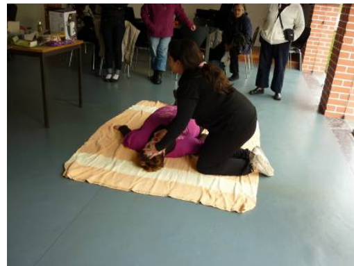
“Noções Básicas de 1º Socorros”, no âmbito do Projecto Vivências, em parceria com o GIS (Grupo de Instrução e Sport)

Ainda em parceria com o Grupo de Instrução e Sport (GIS), no âmbito do Projecto “Bairrus Activus”, foram dinamizadas várias acções, nos diversos bairros sociais.