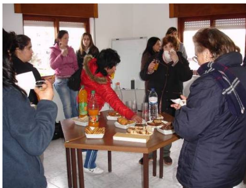
Acções realizadas no Projecto Vivências/ Bairros Activos

Ainda em colaboração com o GIS, realizou-se uma visita ao Café “Afonso”, em Tentúgal, na qual participaram 17 arrendatários e filhos, do Empreendimento do Mártir Santos e Bairro dos Pescadores.