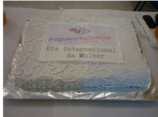
Dia da Mulher - Fonte Nova