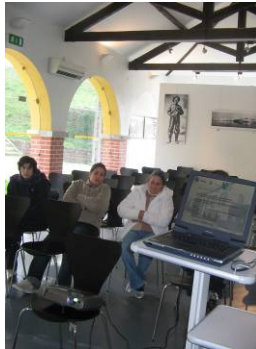
“A Família e o Tabaco”, no âmbito do Projecto Vivências, em parceria com o GIS (Grupo de Instrução e Sport)