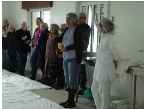
Visita à Vila de Tentúgal Bairros de Buarcos